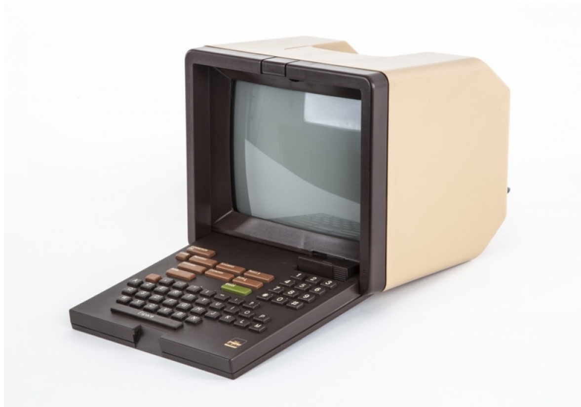
Extrait de L'Essence Même , 2020 Model: Minitel 1 Year: 1983